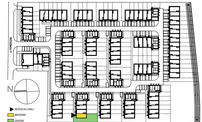
SCHEMAT PARTERU Z OGRÓDKAMI